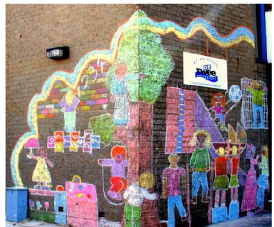
Krijttekening uit Leiden: touwtje springen, hinkelen, voetballen, steltlopen, verstoppertje

2 (in 2015 alle kinderen naar school) centraal. Het verhaal gaat over twee neefjes die elkaar op een familiebijeenkomst ontmoeten. Ze ontdekken dat ze ondanks de verschillen - de een komt van het platteland en de ander uit de stad - veel gemeen hebben. Ze halen graag kattenkwaad uit en gaan samen op stap. Op hun reis zien ze waarom veel kinderen niet naar school gaan: ze moeten werken voor het gezinsinkomen en er is geen geld voor schoenen en schoolboeken. De acteurs speelden heel beeldend, met muziek en dans zodat de kinderen het goed konden begrijpen zonder Spaans te verstaan. De leerlingen en leerkrachten waren heel enthousiast. Het was een genot om de kleintjes uit de onderbouw te observeren, die met open mond, geboeid en doodstil zaten te kijken.