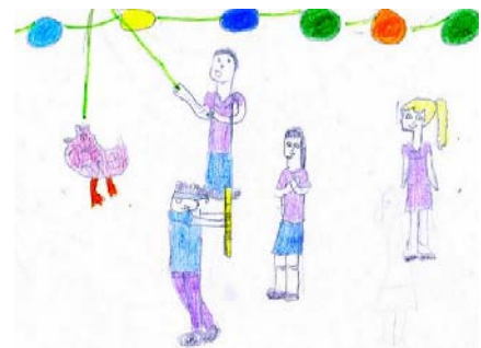
Tekening uit Juigalpa: piñata