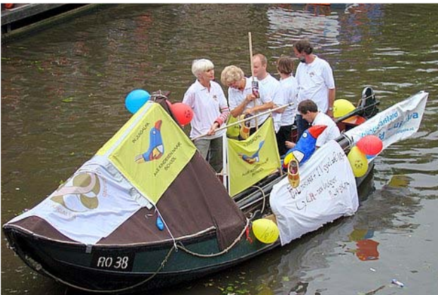
En zo zag hij eruit!

Elk jaar worden de Leidse Lakenfeesten geopend met de traditionele Peurbakkentocht. Op donderdagavond 3 juli was het weer zo ver: heel Leiden kwam op de been om de stoet van mooi versierde peurbakken in de Leidse grachten te aanschouwen! Dit jaar had ook de SVLJ een peurbak voor de campagne voor Millenniumdoel 2: Alle kinderen naar school. Onder vrolijke Nicaraguaanse muziek voer de Stedenband-peurbak mee tussen de andere boten.