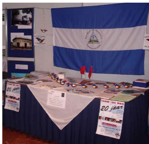
Stand bij het filmfestival tijdens het jubileum